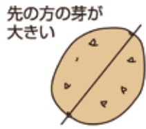
先の方の芽が大きい