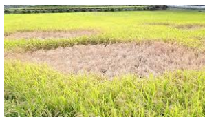
トビロウカによる坪枯れ

今後の状況によっては、本田防除が必要になる可能性があります。現地での発生状況に注意するとともに、病害虫防除所が発信する情報等に十分留意してください。