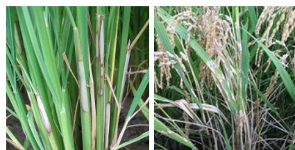
【イネ紋枯れ病】 【止葉紋枯れ病】