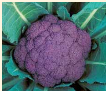
バイオレットクイーン(タキイ) 花蕾が鮮やかな紫色 茹でると濃緑色に変わります。

直径20cm程度(大人の手を広げたくらい)の大きさになったら収穫時期です。花蕾の隙間がある状態になると収穫遅れです。