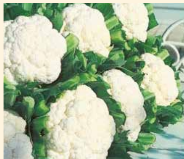
スノークラウン(タキイ) 生育旺盛で栽培しやすい品種 早生品種