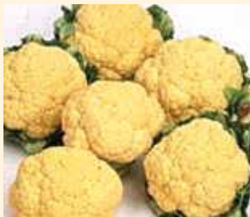
オレンジ美星(サカタ) 花蕾は緻密でドーム型 美しいオレンジ色