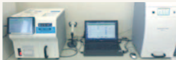
今年度導入した分析機器