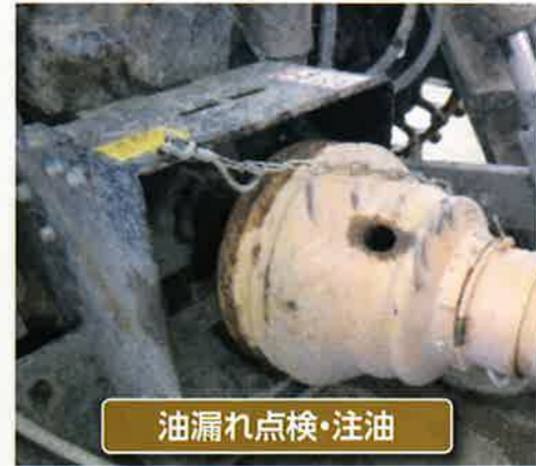
油漏れ点検・注油

日常点検・定期点検を励行するとともに、使用している機械の異常な変化を早期に見ることが重要です。機械の異常(異常音・異常発熱・異常排気ガス・水漏れ・油漏れ・異常振動など)を口頭から注意して点検して下さい。